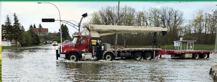
PHÉNOMÈNES CLIMATIQUES EXTRÊMES